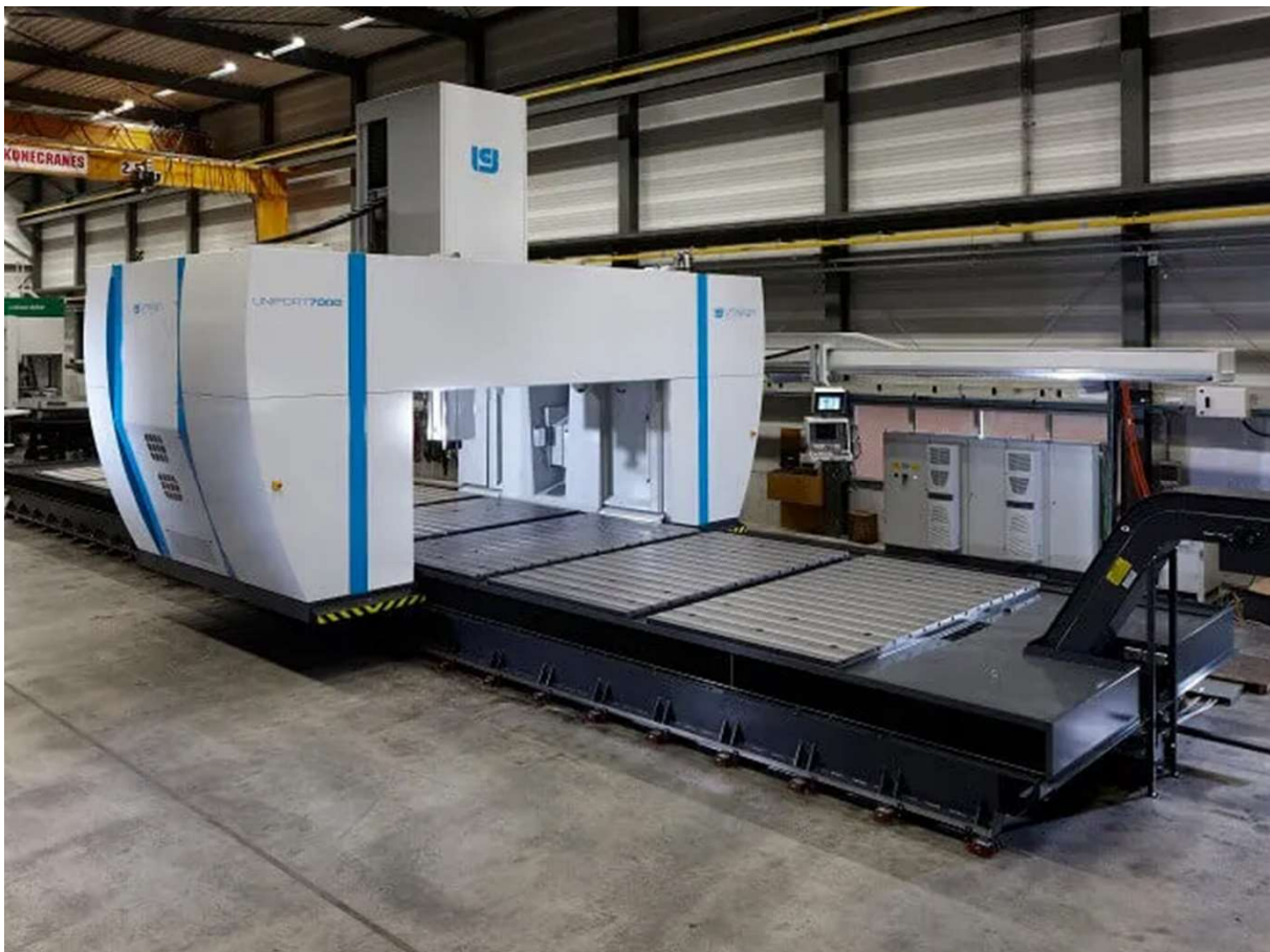
Nieuwste investering bij Bouman is een Uniport 7000 portaalreesmachine.

Bouman Industries geeft de komende tijd voor maximaal €2,5 miljoen obligaties uit via de NPEX-effectenbeurs. Beleggers die inschrijven op de 6-jarige obligatielening ontvangen jaarlijks 9,6% rente op hun inleg. NPEX staat onder toezicht van De Nederlandsche Bank en de AFM.