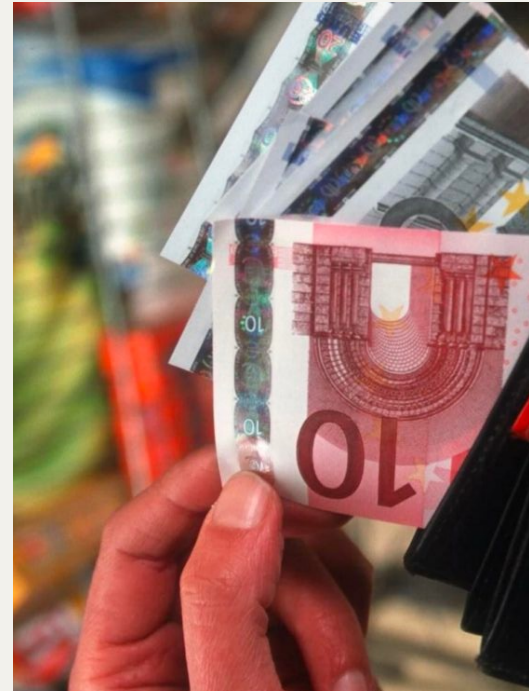
INFLATION / SOARING COSTS