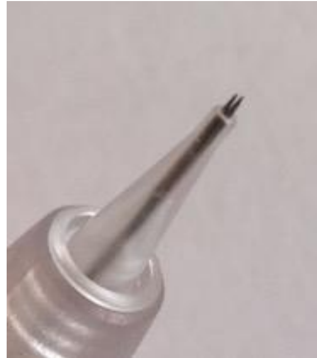
Foto: Een 3-puntnaald waarvan de naaldjes nu uitsteken uit het huis (vergroting)