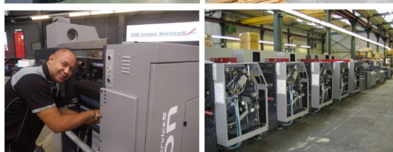
VSOP in revisie bij DG press in onze montagehal