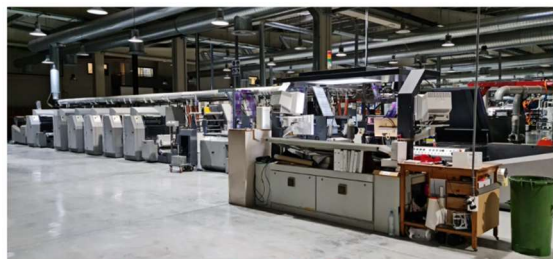
VSOP nog in productie bij Etiquetas Macho

Momenteel wordt de machine klaargemaakt voor transport en in het najaar weer opgebouwd in Koeweit.