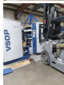
Installatie bij Parkland