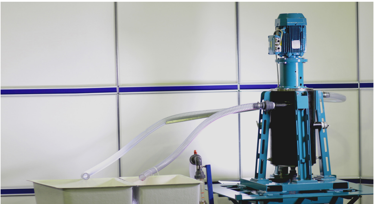
Centri Tech Separations Twente B.V., actief in producten voor scheiding van vloeistoffen zoals (vervuild) water, genomineerd voor de Jan Terlouw Innovatieprijs 2015.