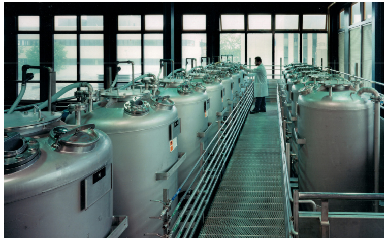
Bouman ontwikkelt mechanische verpakkingsmachines, verpakkingslijnen en complete installaties voor Polaroid.

De textielmarkt loopt ten einde en andere markten zoals de zuivel- en voedingsmiddelenindustrie komen op. Het personeel wordt deels omgeschoold naar leiding lassen, het installeren van installaties en de ondersteuning van technische diensten bij melk- en andere aan voeding gerelateerde bedrijven. Bouman wordt leverancier voor Ormet, het huidige Campina, voor de ontwikkeling van machines en installaties voor de productie van melkpoeder.