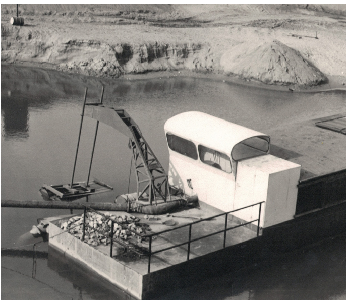
Bouman ontwikkelt, produceert, installeert en onderhoudt zandhoppers en complete zandzuiginstallaties.

Veel textielproducenten uit de regio Twente gaan ter ziele door de opkomst van de lagelonenlanden. De textiel fabrieken worden afgebroken en de machines elders ter wereld opgebouwd. Bouman past zich aan en specialiseert zich in het ontmantelen en opbouwen van de textielmachines in de lagelonenlanden, waar ook ter wereld.