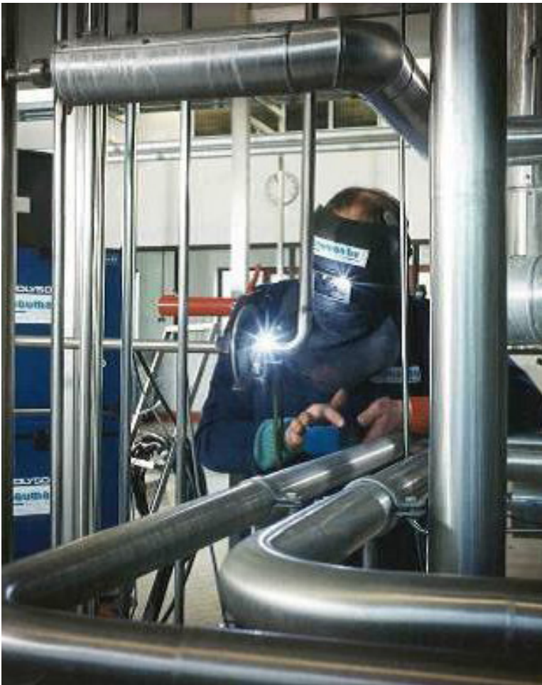
Orbitaal lassen op locatie bij Abbott in 2003.